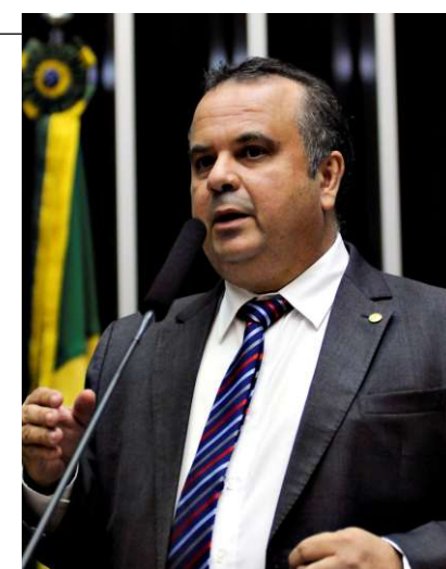
Zeca Ribeiro/Câmara dos Deputados

Marinho também vai propor o aumento do prazo do trabalho temporário para 180 dias (a reforma eleva os atuais 90 dias para 120 dias) e quer incluir o trabalho intermitente na discussão. "A jornada móvel por