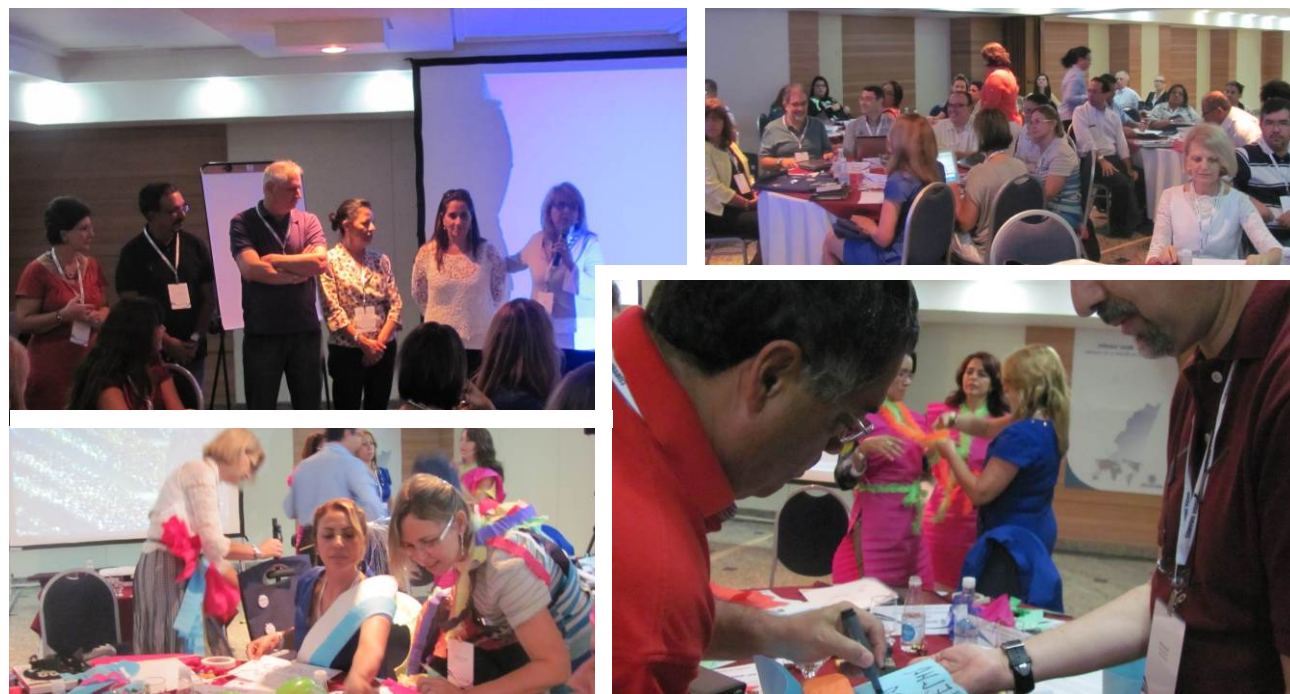
Alinhamento, integração e descontração deram o tom aos dois dias de atividades