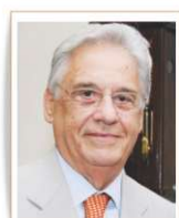
Fernando Henrique Cardoso Ex-presidente da República e presidente da Fundação iFHC

Eles estarão lá para a nossa construção coletiva. E você?