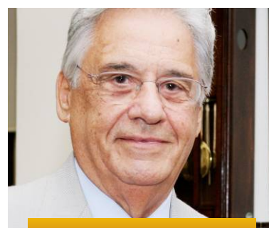
FERNANDO HENRIQUE CARDOSO