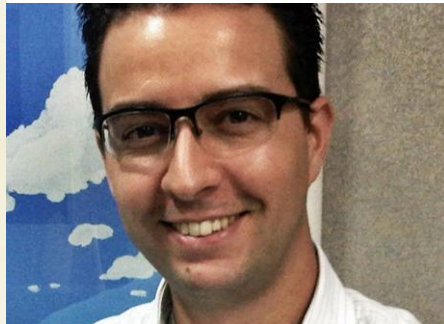
Bandini: líderes presentes

A mudança exigiu um acordo com o sindicato e, inicialmente, os profissionais tiveram dúvidas se iriam se adaptar ao projeto. “A necessidade de contato humano é inerente às pessoas, ainda mais quando trabalham na área comercial. Pedimos um voto de confiança e demos a eles a credibilidade de que seriam capazes de trazer resultados e se manter engajados. Ninguém até hoje saiu por isso, ao contrário, as pessoas conseguem se organizar melhor e ter mais tempo para a vida pessoal”, garante.