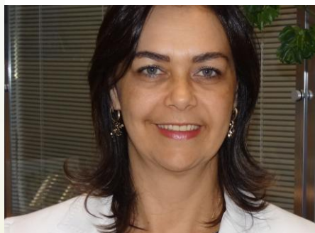
Edna: engajamento e resultados

A pesquisa de clima interno reflete o sucesso da iniciativa: os resultados são até 15% mais elevados para os funcionários que têm flexibilidade no ambiente de trabalho. “Atualmente, esse modelo é um dos principais fatores de retenção desse grupo de profissionais”, garante Bandini.