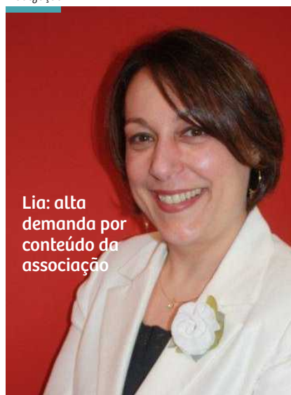
Lia: alta demanda por conteúdo da associação

acesso a todas as apresentações, apenas acessou, em seu laptop, a plataforma ABRH Digital, lançada recentemente pela ABRH-Brasil.